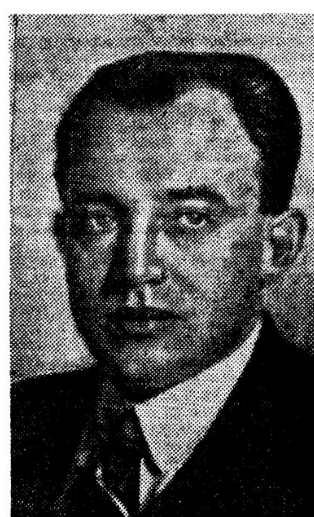
Александр Евдокимович Корнейчук. Баллотирован в депутаты Совета Союза от Звенигородского избирательного округа, Киевской области.

В своей автобиографии — письмо к редактору журнала «Народное творчество» Тарас Григорьевич Шевченко пишет: «Я — сын крепостного крестьянина...»